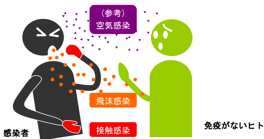
図1 新型インフルエンザの感染経路

ウイルスは細菌とは異なり、粘膜・結膜などを通じて生体内に入ることによって細胞の中でのみ増殖することができる。環境中（机、ドアノブ、スイッチなど）では状況によって異なるが数分間から長くても数十時間内に感染力を失うと考えられている。