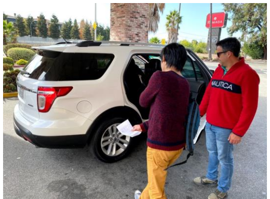
移動は uber で