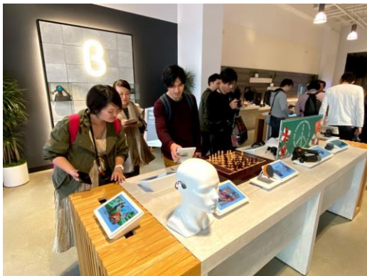
スタートアップが商品を展示・販売する「B8ta」