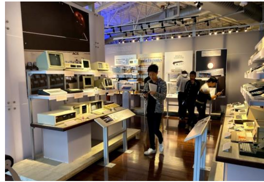
コンピュータ歴史博物館