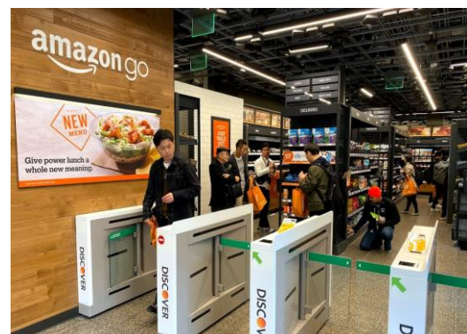
Amazon go (サンフランシスコ)