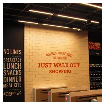
amazon go (サンフランシスコ)