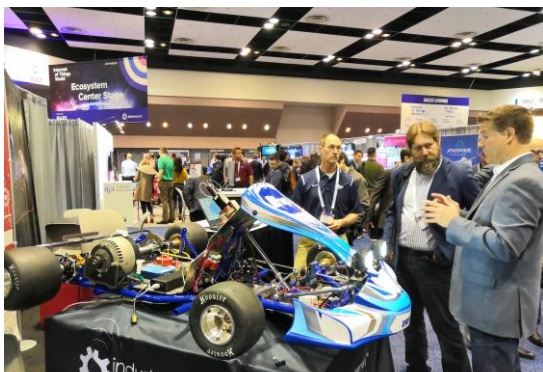
IoT World Expo (サンタクララコンベンションセンター)

起業を目指す人々が利用する共有ワークスペース。運営費は個人の会費のほか、企業からの寄付金でまかなわれている。