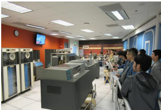
コンピュータ歴史博物館