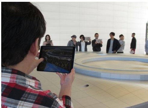
Apple Park ビジターセンター