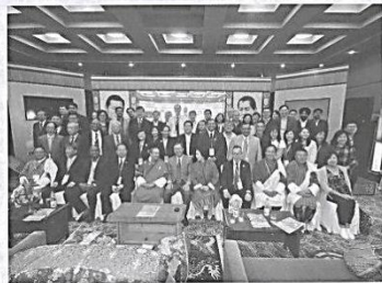
More than 50 ICT industry players from 24 ASOCIO member countries participated in the event.