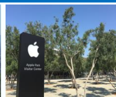
Apple ビジタセンター (イメージ)