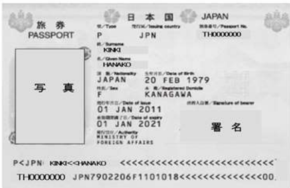
【顔写真ページ見本】 ↴